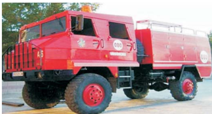
Camión modelo egipcio, retirado del servicio en algunas CCAA por problemas de seguridad

que desempeñan no implican un grave riesgo, entendiéndose este como: el que resulte racionalmente probable que se materialice en un futuro inmediato y pueda suponer un daño , es de aplicación plena la Ley 30/95 y su